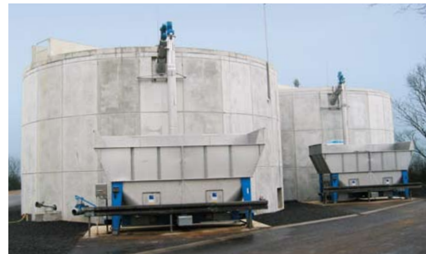
Freitragende Decken mit Zentralrührwerk