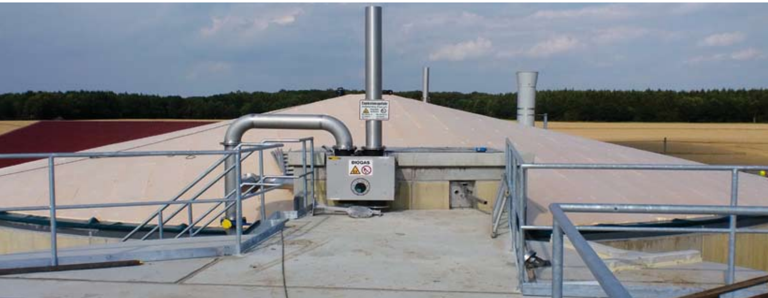
Multifunktionale Befahreinrichtung mit Installationen