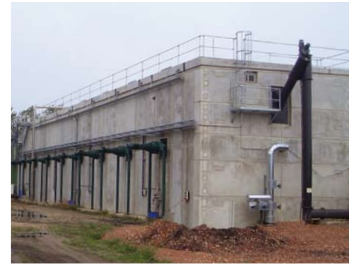
Rechteckfermenter in Sandwichbauweise