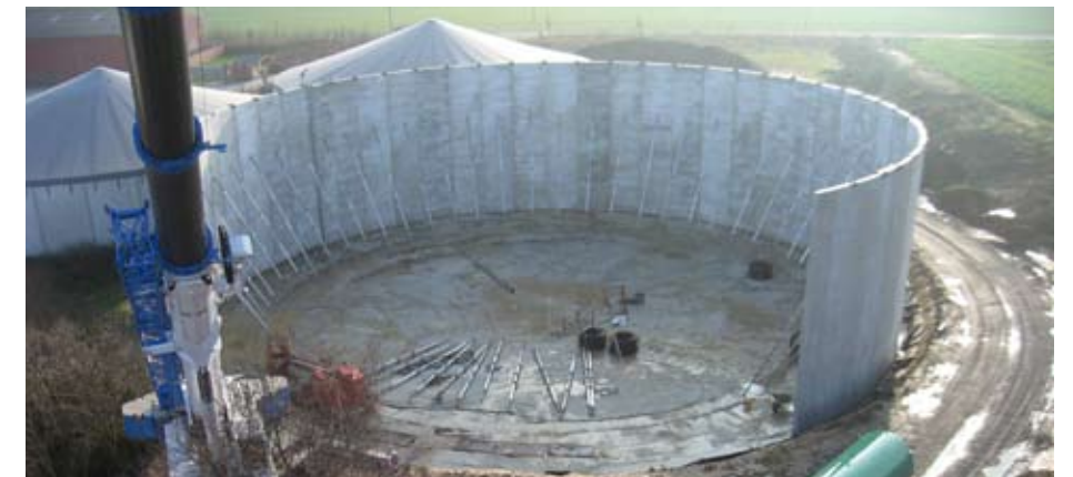
Gärrestlager 10.500 cbm

In unserem eigenen Fertigteilwerk produzieren wir die hochwertigen Bauteile für alle Behältertypen. Erfahrene Konstrukteure und Statiker sind hier ebenso mit der präzisen Planung und Ausführung beschäftigt wie unsere motivierten Teams von Ingenieuren, Polierern und Facharbeitern.