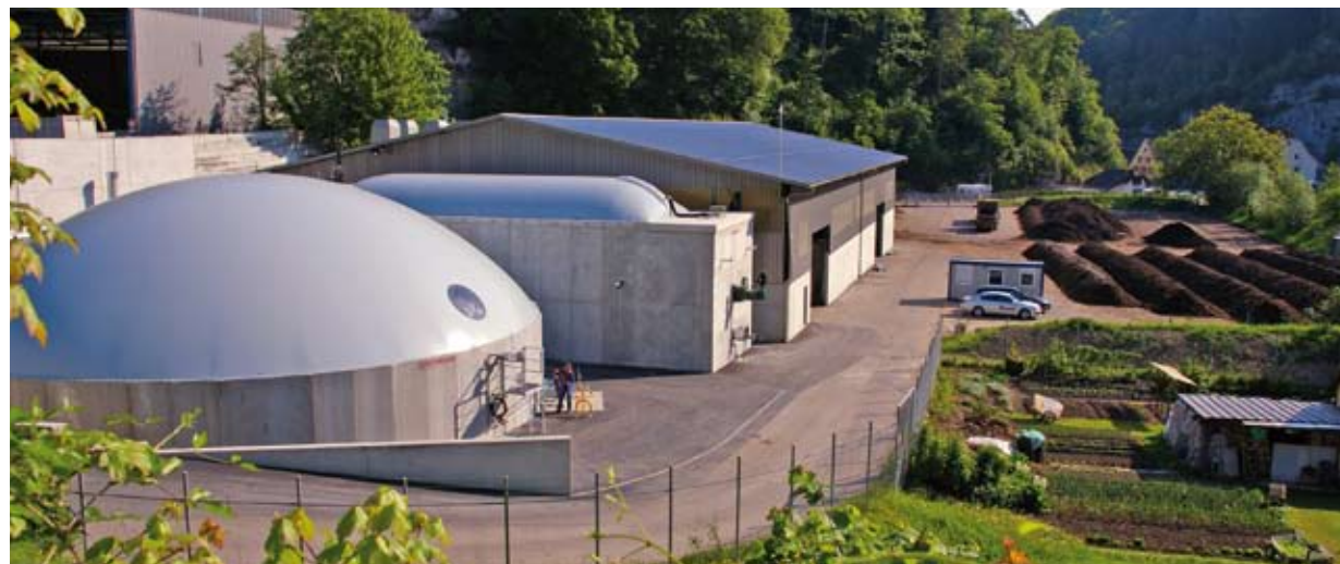
Gärrestlager aus RESOCRET, Pfpfenstromfermenter