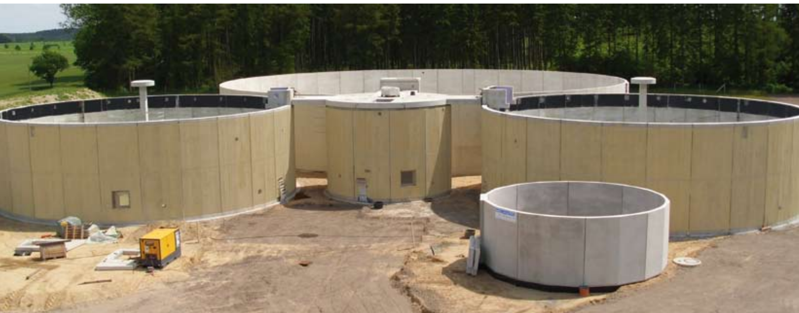
Fermenter und Nachgärer in Sandwichbauweise (Beton eingefärbt)