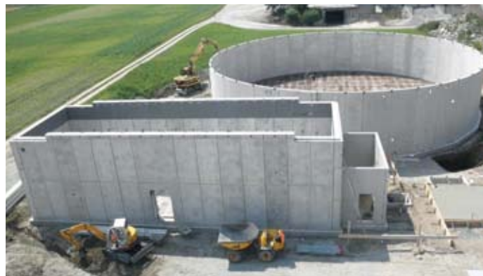
Pfropfenstromfermenter / Gärrestlager aus RESOCRET