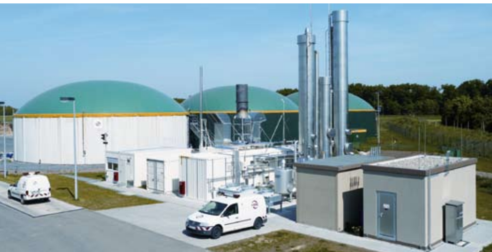
Biogasanlage mit Gaseinspeisung